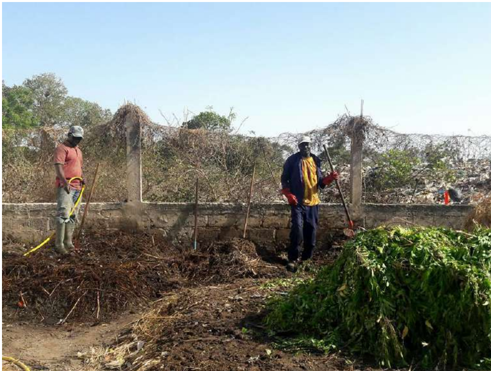
La creazione delle fosse per la produzione di compost