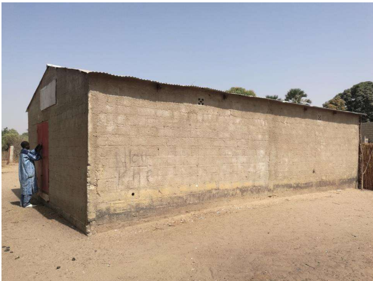
Il magazzino a Mboul Diamé