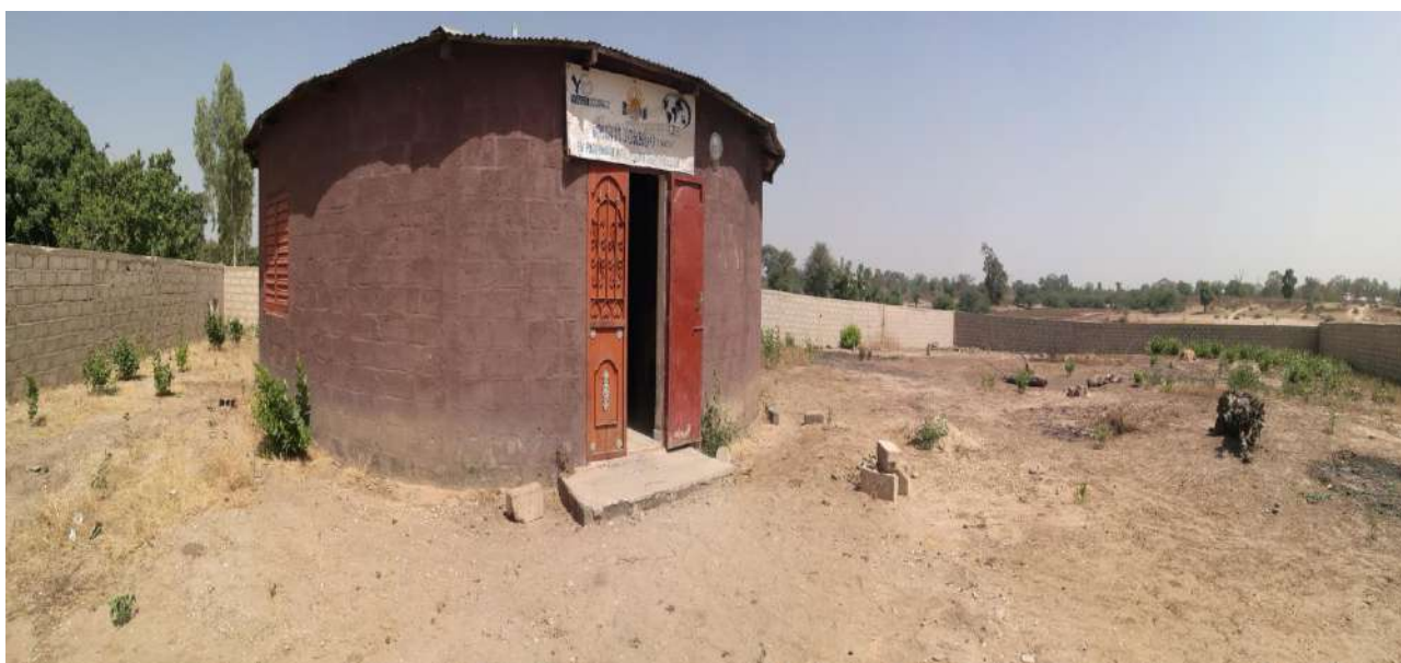
La sede del GIE Touris Jokkoo