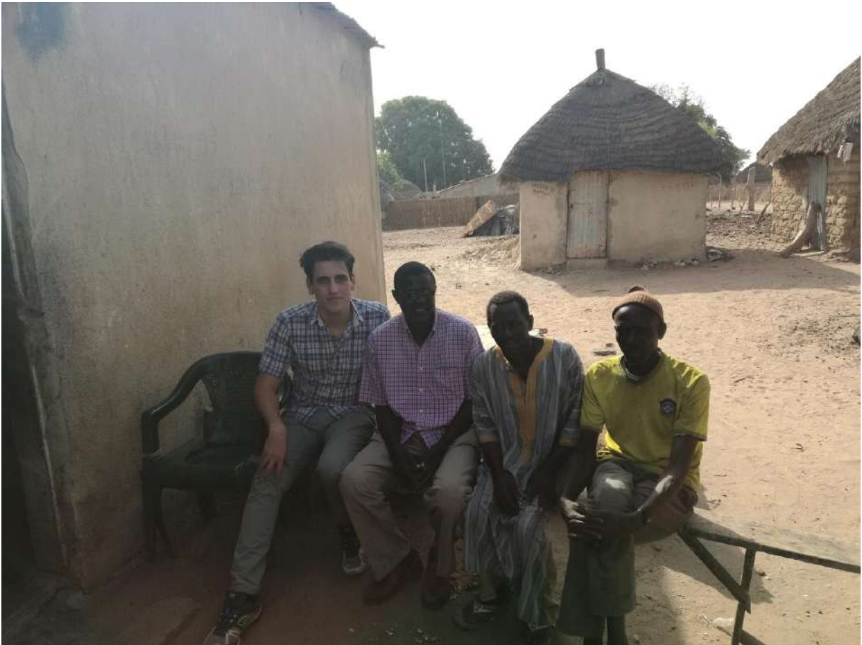
La casa del referente di Petit Ndongone