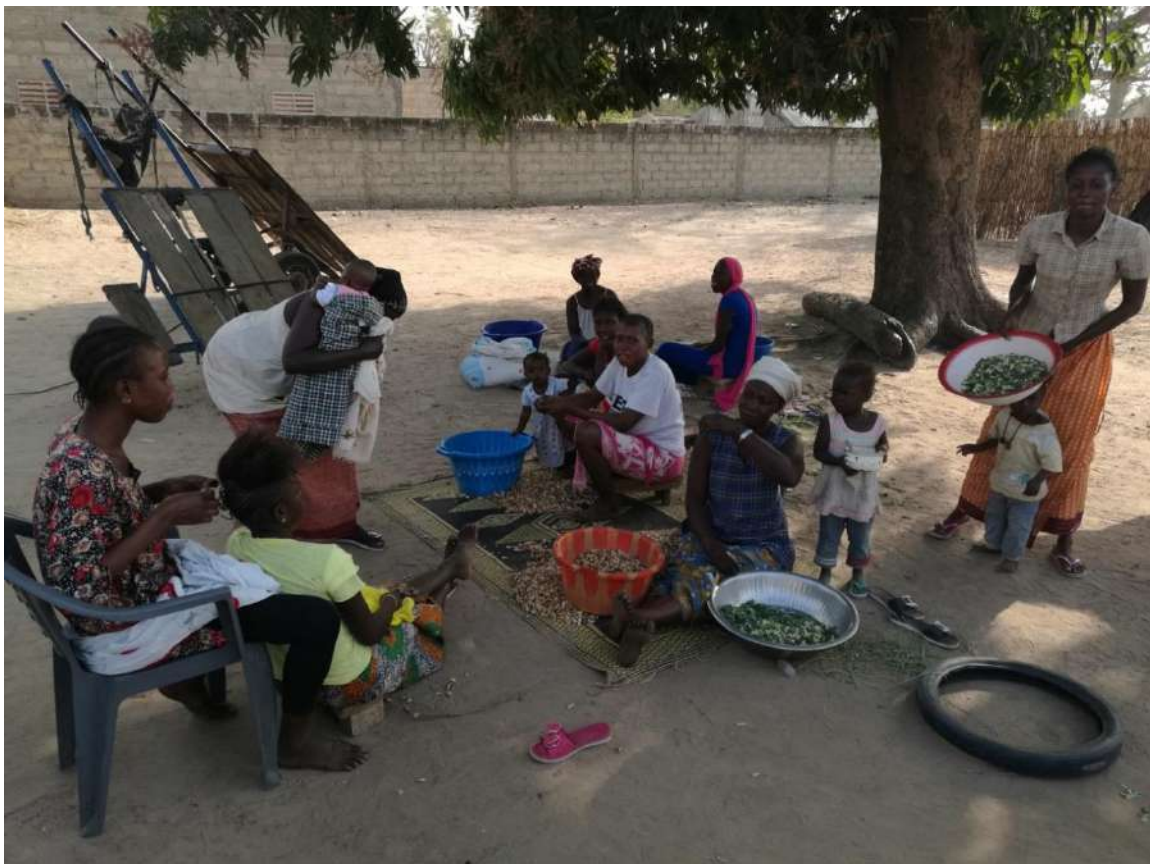
Le donne di Grand Ndongone